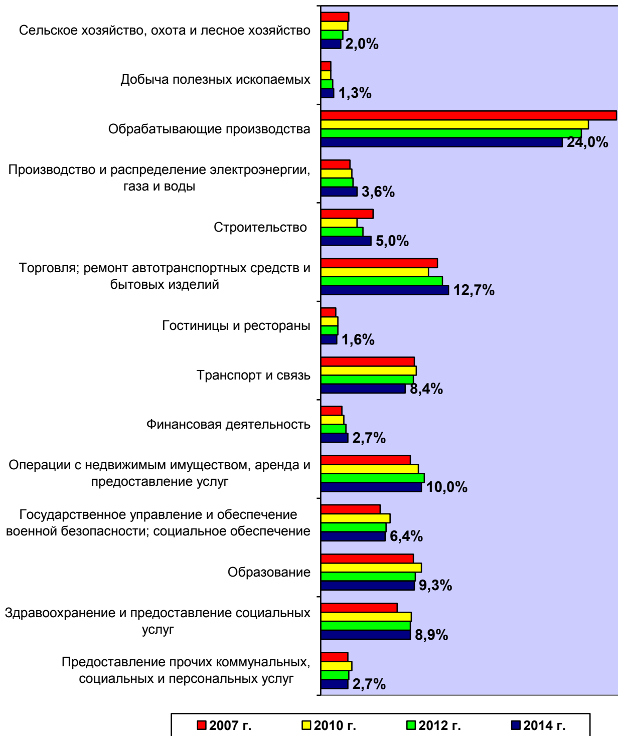
Диаграмма 2. Структура среднесписочной численности работников организаций Самарской области по видам экономической деятельности в 2007-2014 гг.

Рассматривая динамику изменений численности работников по видам экономической деятельности за последние годы (диаграмма 2), отметим, что отраслевая структура занятости претерпела лишь незначительные изменения. Слабая, но очевидная