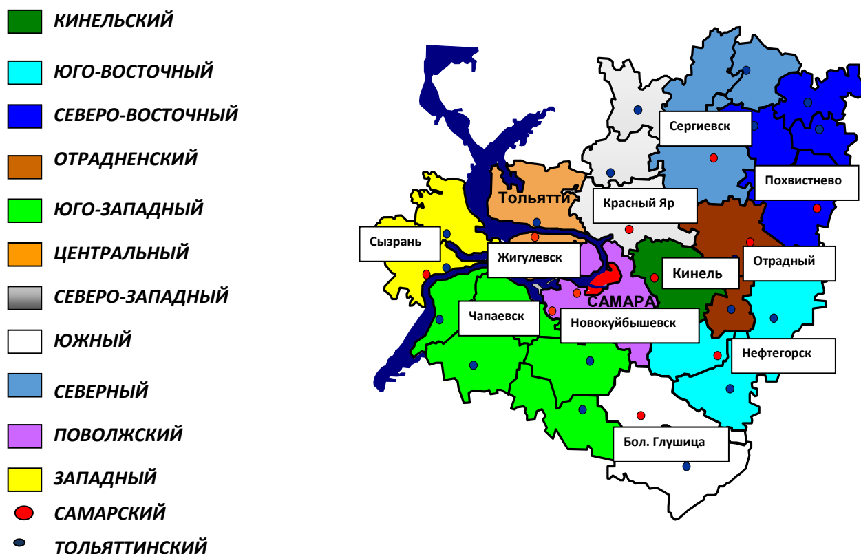
Рисунок 1. Карта образовательных округов Самарской области (территориальных управлений министерства образования и науки Самарской области)

Рассмотрим специфику экономического развития муниципальных образований по их принадлежности к образовательным округам – территориальным управлениям министерства образования и науки Самарской области.