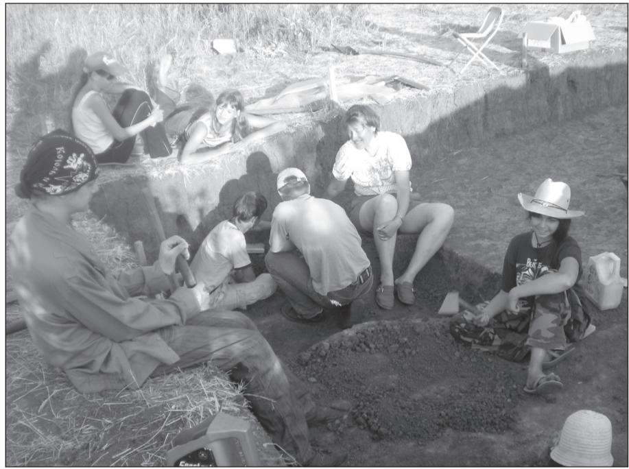
Юные археологи с огромным интересом перекапывают почву в поисках останков древнего «Муромского городка».

В 1236 году монголы, собрав огромное войско, вновь двинулись на Булгарию. «Муромский городок» был обречён. Битва была страшной. Первую, затем вторую линию оборо-