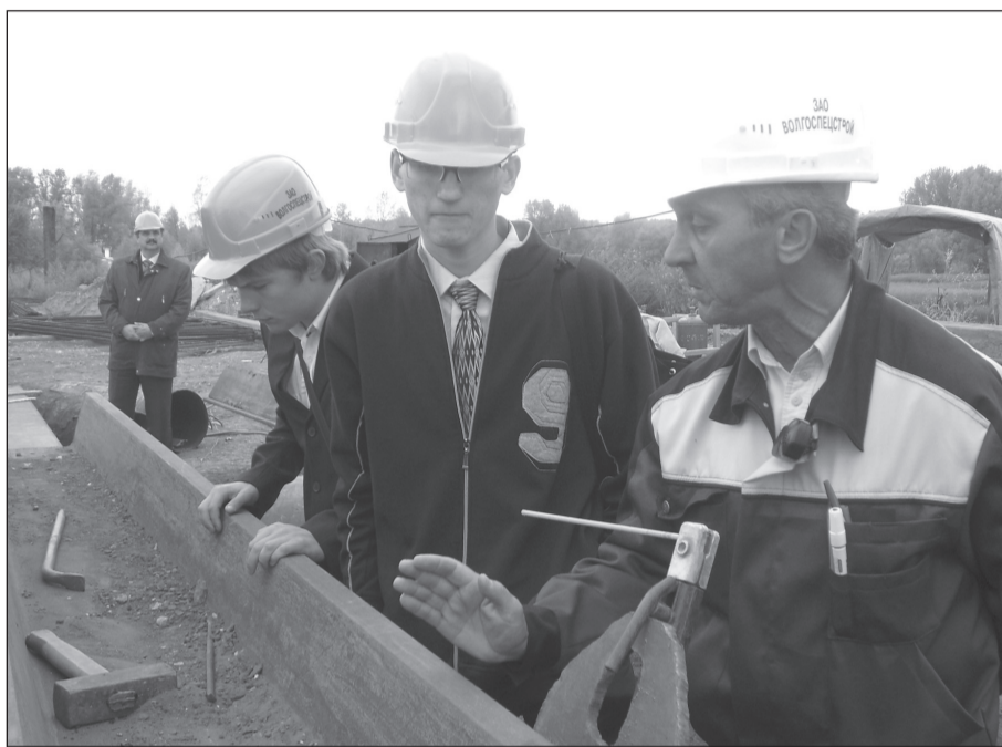
Молодые специалисты на практике.

Существенное преимущество выпускников перед своими опытными коллегами состоит в их высокой мобильности, динамичности. Они «легки на подъём», всё «ловят на лету». Приходя в новый коллектив, вчерашние